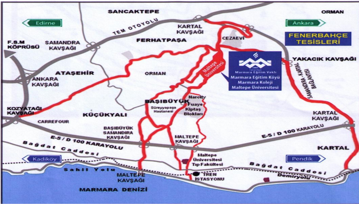
Şekil 4.Kampüs Krokisi

Tüm binalar engelli öğrencilere uygun olacak şekilde düzenlenmeye çalışılmıştır. Yurt Binaları, Üniversite kampüsü içinde 600 öğrenci kapasiteli 14 ayrı binadan oluşmaktadır. Marmara Eğitim Köyü'ndeki Üniversite kampüsünde şu anda tüm bloklar bitirilmiş ve kullanılmaktadır. Üniversite'nin yerleşim planı içinde neredeyse her fakültenin ayrı bir binada olması sağlanmıştır. Sağlık Hizmetleri kampüste bulunan 2 katlı ayrı bir bina olan sağlık merkezimizde yürütülmektedir. Ayrıca, kampüste geleneksel Türk yemeklerinden fast-food yiyeceklere kadar çeşitli alternatifler sunan birçok restoran/kafe ve ana kafeterya yer almaktadır.