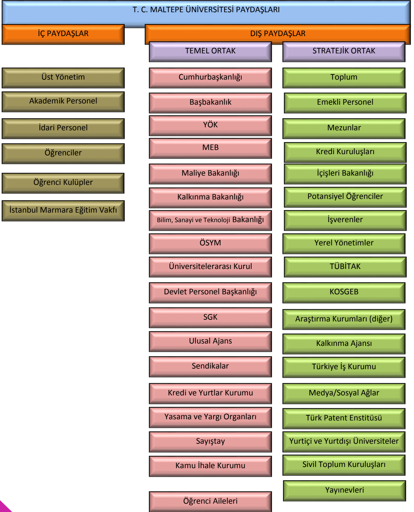
Şekil 1. Paydaş Analizi